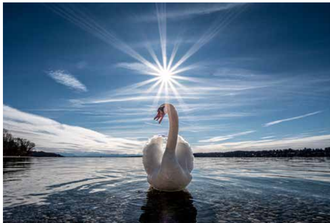
Motive mit kreativem Blick